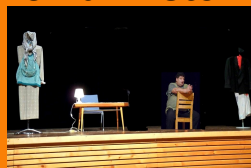
KABARET, TO JE SVĚT KOLEM NÁS