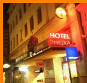
HOTEL A' LA DIVADLO