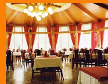
RESTAURANT A' LA HLEDIŠTĚ